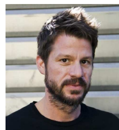
Schirmherr Flo Dauner, Die Fantastischen Vier & Voice of Germany