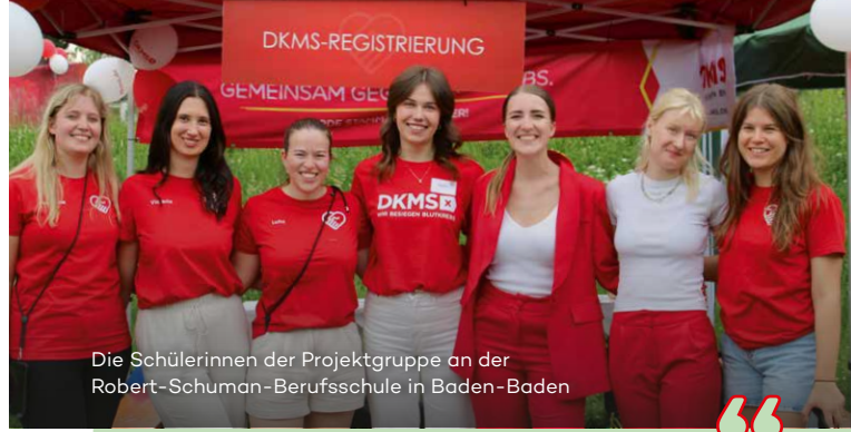
Die Schülerinnen der Projektgruppe an der Robert-Schuman-Berufsschule in Baden-Baden